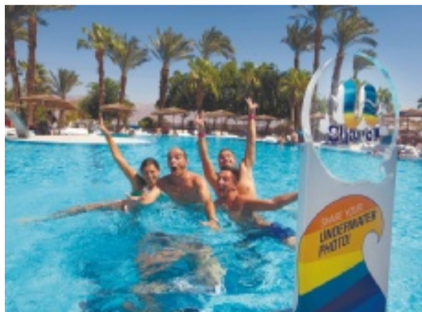
נהנים ומתייגים. יו קורל ביץ' קלאב אילת

כיצר קדומים 9, יפו העתיקה. טל' 03-6832211