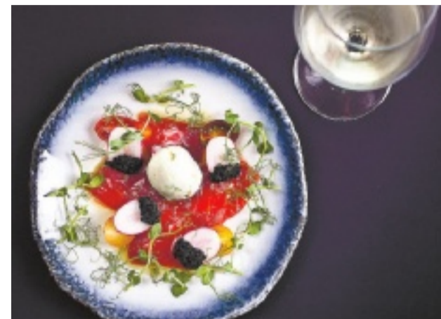
הלנה בנמל קיסריה