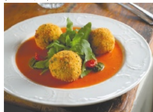
סרדיניה החדשה ביפו